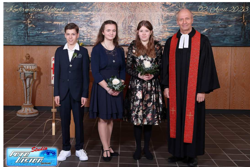
Konfirmation am 02.04. und 16.04.